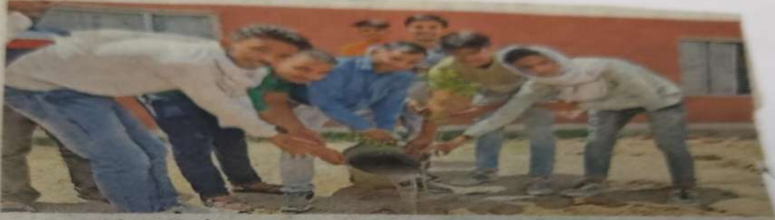
जनता कॉलेज पे पौधारोपण करते विद्यार्थी।