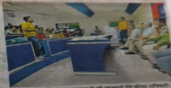
जनता कॉलेज में साइबर जागरूकता की जानकारी देते पुलिस अधिकारी।

प्लेटफॉर्म को सावधानी और सतर्कता के साथ प्रयोग करना जरूरी है। आज जिस तरह से अपराधियों के द्वारा साइबर अपराध को अपराध का एक सशक्त माध्यम बनाकर प्रयोग किया जा रहा है। उससे बचने के लिए छात्रों को स्वयं जागरूक होकर दूसरों को भी जागरूक करना होगा। जालसाज अब क्यूआर कोड (क्विक रिस्पॉन्स कोड) लिंक के जरिए बैंक खाते हैंक करने लगे हैं। जालसाज प्रसिद्ध वेबसाइट पर खरीदारी करने वालों को झांसे में ले रहे हैं। इस दौरान यह क्रय-विक्रय की बात फाइनल कर ऑनलाइन पेमेंट की बात कहते हैं। इसके बाद लोगों के वाट्सअप नम्बर पर एक लिंक पर क्लिक करते हैं, ठग लोगों के मोबाइल फोन का क्यूआर कोड स्कैन कर खाते में रकम पार कर दे