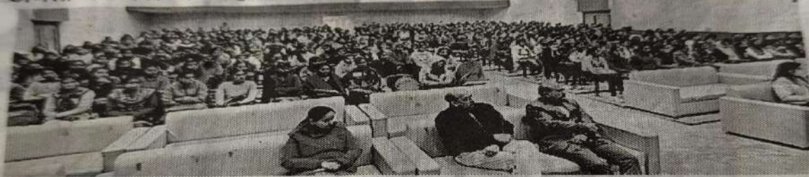
जनता कॉलेज में महिला प्रकोष्ठ द्वारा आयोजित व्याख्यान में मौजूद विद्यार्थी।