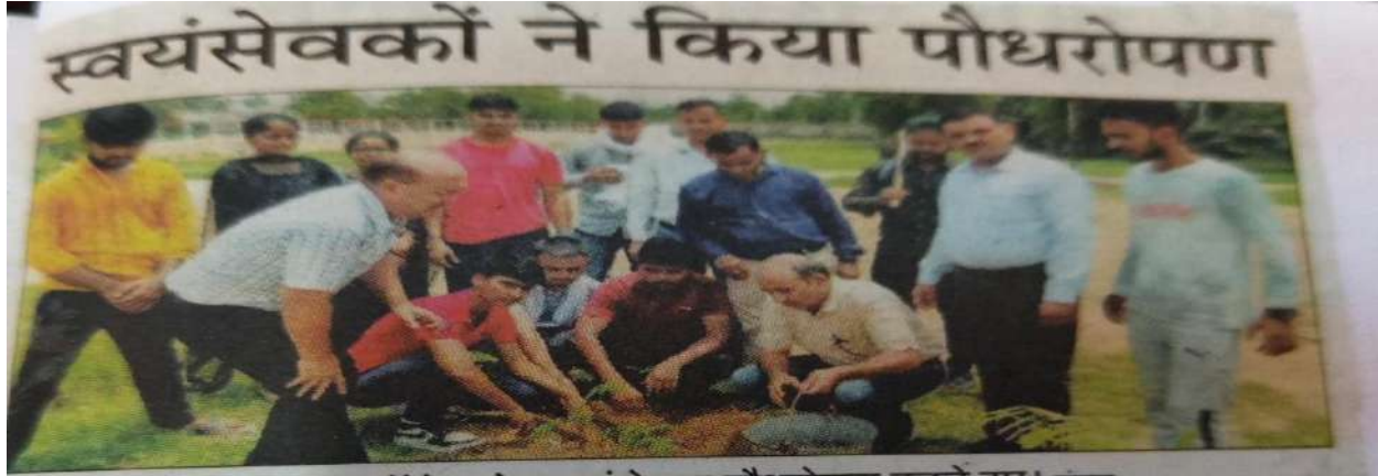
जनता कॉलेज के स्वयंसेवक पौधरोपण करते हुए। संवाद

चरखी दादरी। जनता महाविद्यालय में राष्ट्रीय सेवा योजना इकाइयों के संयुक्त तत्वाधान में पौधरोपण कार्यक्रम आयोजित किया गया।