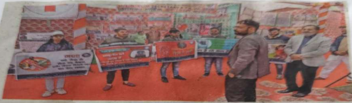
दादरी। जागरूकता रैली निकालने वाले युवाओं को टिप्स देते सीटीएम।